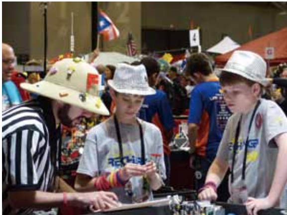
FLL世界大会2014年度ピットの様子/2015年4月開催