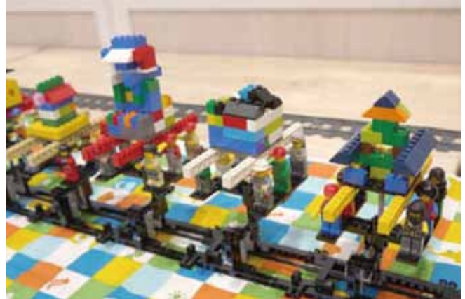
動くお神輿づくりワークショップ開催/11/14開催/五十川芳仁講師による