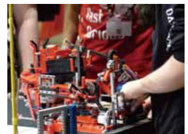
FLL世界大会2014年度ピットの様子_日本チームのピット