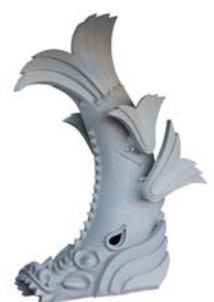
o. 姫路城天守閣の鯨（復元品） （※特別展示）