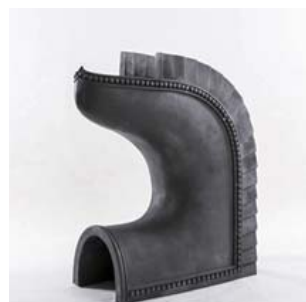
n. 唐招提寺金堂の鴟尾（復元品）