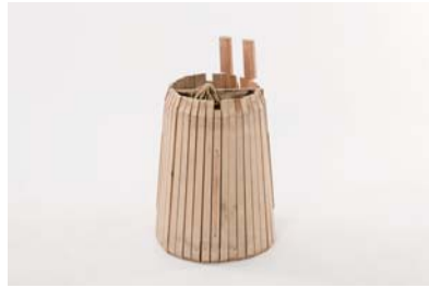
c. 古代の平瓦製作道具（復元品）