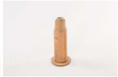
d. 古代の丸瓦製作道具（復元品）