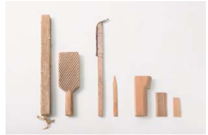
g. 古代瓦の製作道具（復元品）