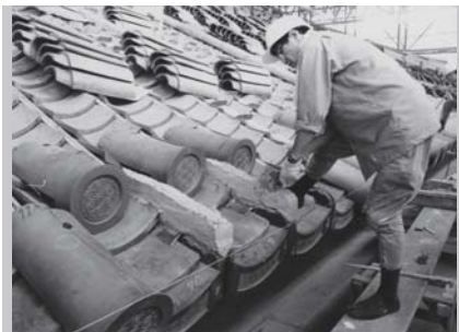
k. 屋根を葺いている様子 / 東大寺大仏殿