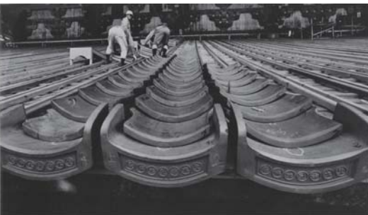
j. 屋根を葺いている様子 / 東大寺大仏殿