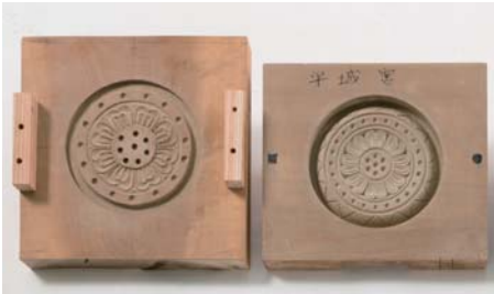
e. 軒丸瓦の木型（復元品）