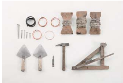
i. 瓦を葺く道具（一部）