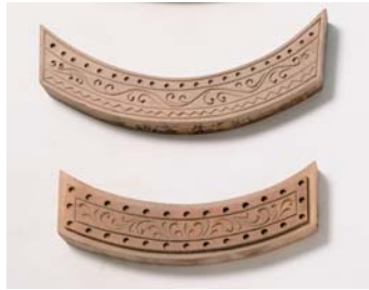
f. 軒平瓦の木型（復元品）