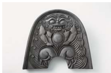
m. 平城宮の鬼瓦（復元品）