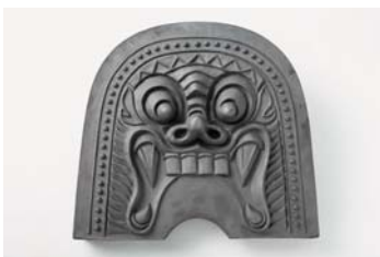
l. 東大寺の鬼瓦（復元品）