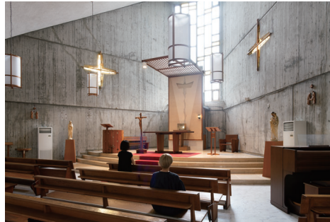
i. カトリック桂教会