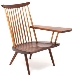
d. ラウンジアームチェア 所蔵: 桜製作所