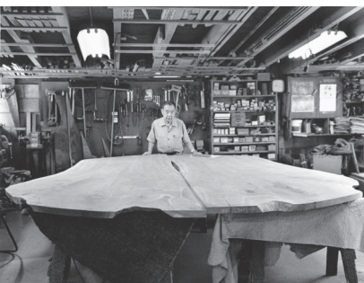
j. 「平和の聖壇」の ブラックウォールナット材とナカシマ 提供: Nakashima Foundation for Peace New Hope, PA Nakashimafoundation.org