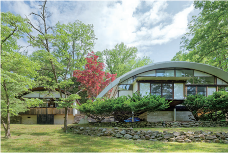
a. コノイド・スタジオ