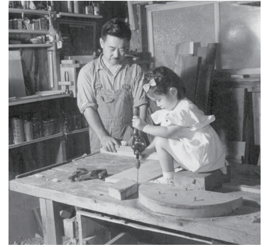
ジョージ・ナカシマと長女ミラ 1940年代

日系2世としてアメリカ・ワシントン州で生まれ育ち、マサチューセッツ工科大学などで建築を学ぶ。1934年から39年にレーモンド事務所に勤務し、インドの僧院ゴルコンデの現場監理などを担当。帰米後の42年に日系人収容施設に抑留され、戦後ニューホープに家具工房を設立する。日本では、カトリック桂教会(1965)を設計。世界に「平和の聖壇」を置く活動は、ナカシマ平和財団としていまに継承されている。