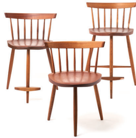
e. ミラチェア 左からミディアム、ロー、ハイ 所蔵: 桜製作所