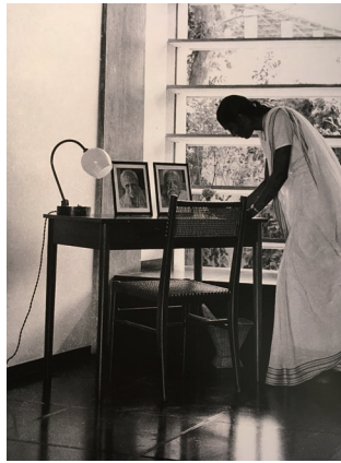
f. ゴルコンデ