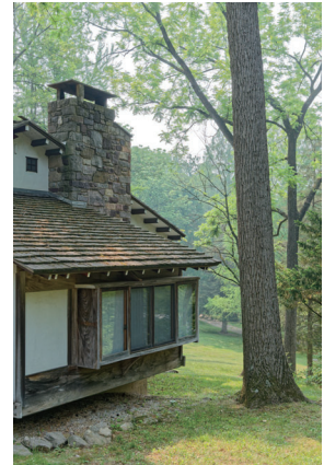
c. レセプション・ハウス