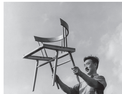
l. ジョージ・ナカシマ