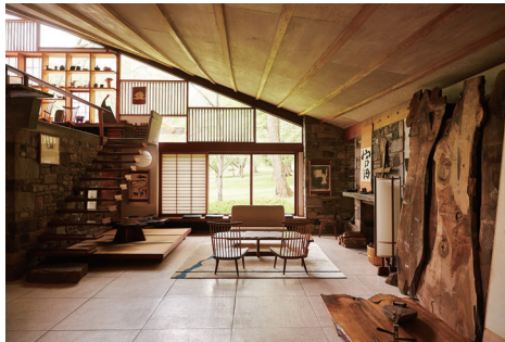
b. アーツ・ビルディング